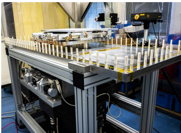
Piattaforma a specchio con stadi di movimento sia in aria che nel vuoto

Prima della consegna al cliente, ogni sistema a specchio IRELEC viene calibrato e qualificato utilizzando il sistema di calibrazione laser di Renishaw.