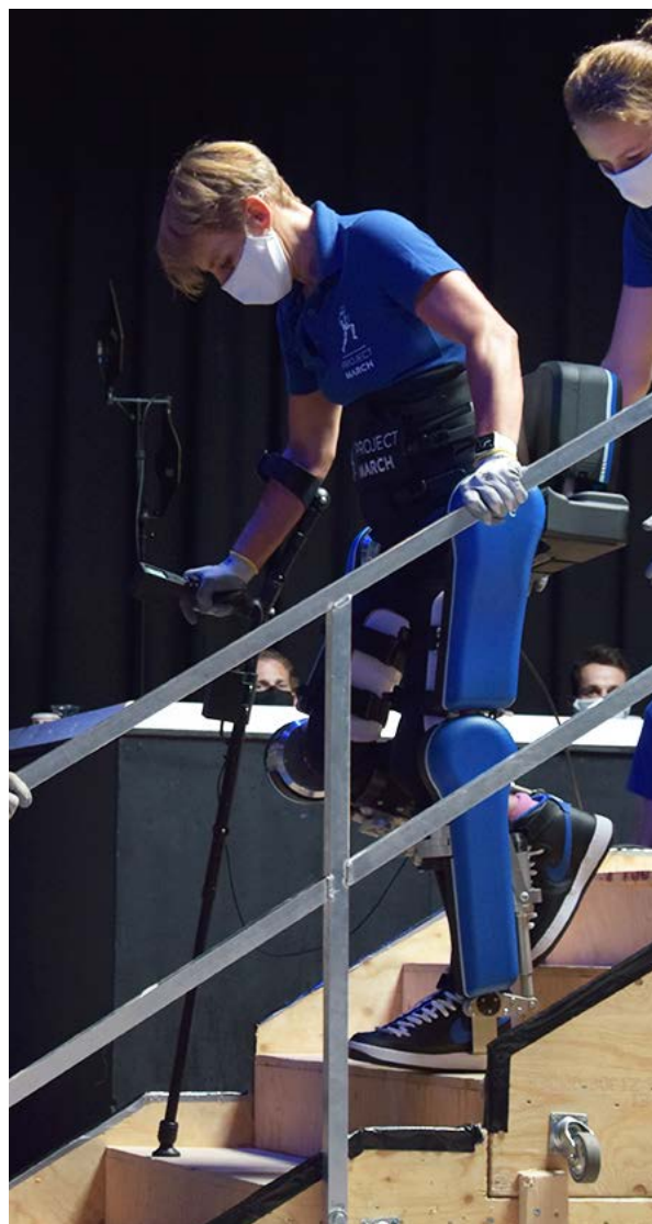
Project MARCH strijdt in de Cybathlon 2020 competitie

“Aan het begin van het jaar hebben we een ontmoeting gehad met René van der Slot, de sales engineer van Renishaw, en Björn en de rest van de elektrotechnische afdeling. René bracht ons niet zomaar de encoders en zei: ‘goed, je moet dit of dat gebruiken’. In plaats daarvan dacht hij aan onze toepassing en vroeg hij hoe ons exoskelet werkte en wat we nodig hadden. Dus Renishaw en RLS probeerden ons niet iets te verkopen wat we niet nodig hadden. Ze dachten na over wat het was dat we nodig hadden en hoe ze ons daarmee konden helpen.