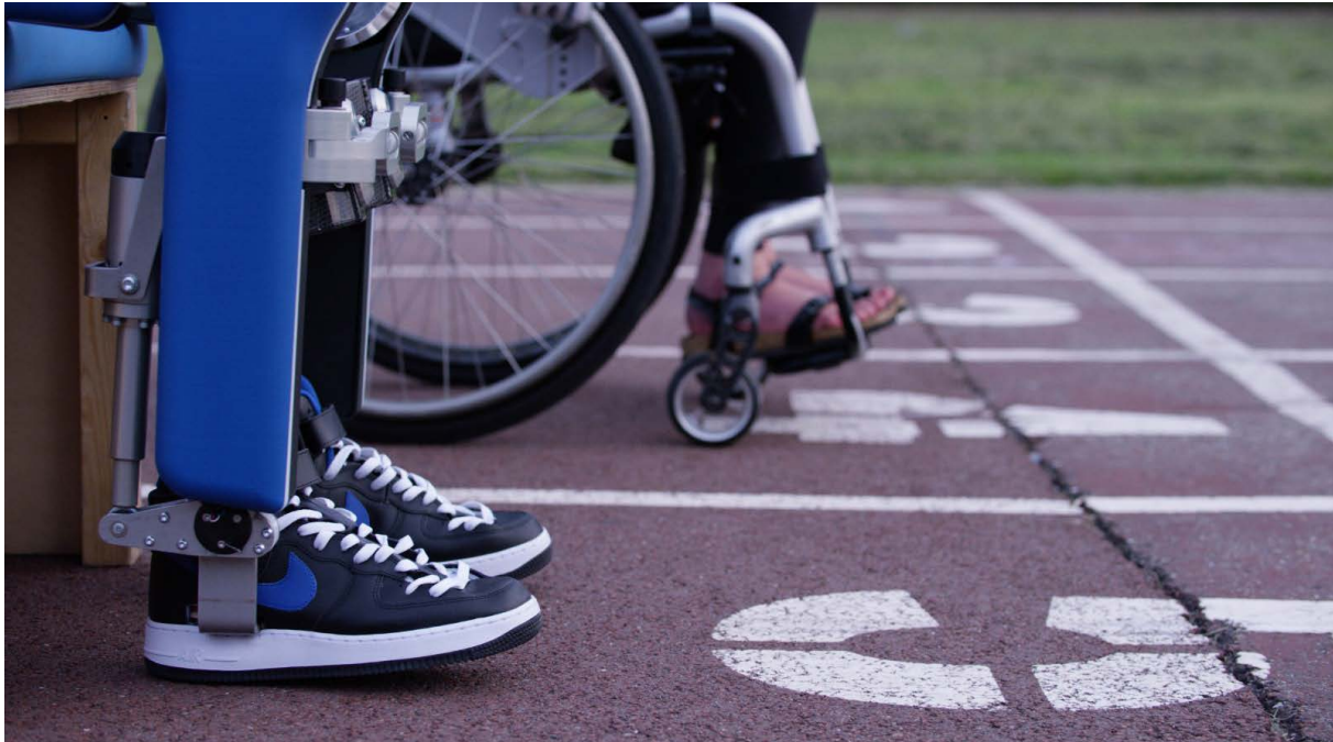
Project MARCH Ivc exoskelet en conventionele rolstoel aan de start